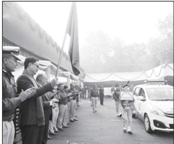
गृह राज्य मंत्री श्री किनेन रिंजिजू नई दिल्ली में पूर्वोत्तर सहायता दल को हरी झंडी दिखाकर रवाना करते हुए। इस अवसर पर दिल्ली के राज्यपाल श्री अनिल बैजल और दिल्ली पुलिस के आयुक्त श्री अमृल्प पटनायक भी उपस्थित हैं।

अधिक सम्मानजनक तरीके से मानव शरीर का इलाज करेगी। उन्होंने आशा व्यक्त की कि पीजीआईएमईआर, चंडीगढ़ इसमें अपनी भूमिका निभाएगा। श्री अरोड़ा ने मेडिकल विद्यार्थियों से चुनौती के समय भी अपना नैतिक मनोबल ऊंचा बनाए रखने का आग्रह किया। उन्होंने कहा कि विचार विश्व में शासन करते हैं। उन्होंने कहा कि हम पहुंच और संसाधन के मामले में उतना सीमित नहीं हैं, जितना कि अपनी कल्पना के मामले में सीमित है। श्री सुनील अरोड़ा ने कहा है कि आज की औषधि बीते कल का अनुसंधान है और आज का अनुसंधान कल की औषधि बन जाएगा। इसलिए लीक से हटकर सोचने की जरूरत है। मुख्य निर्वाचन आयुक्त ने कहा कि पीजीआईएमईआर का 50 वर्ष पुराना गौरवशाली इतिहास है। सवाल यह है कि आज से 10, 20 या 50 वर्षों में हम कहाँ देखेंगे। उन्होंने कहा कि वर्तमान नेतृत्व की दूरदृष्टि, संकल्प तथा उत्साह इस बात का निर्धारण करेगा।