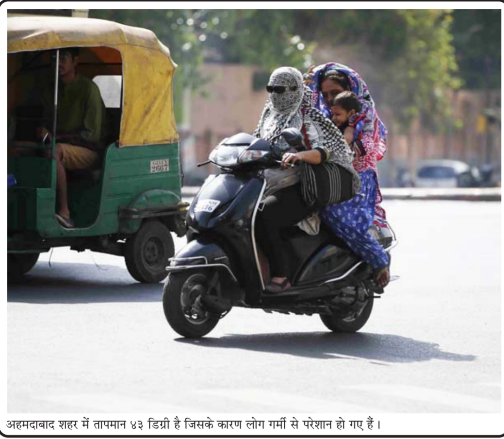
अहमदाबाद शहर में तापमान ४३ डिग्री है जिसके कारण लोग गर्मी से परेशान हो गए हैं।