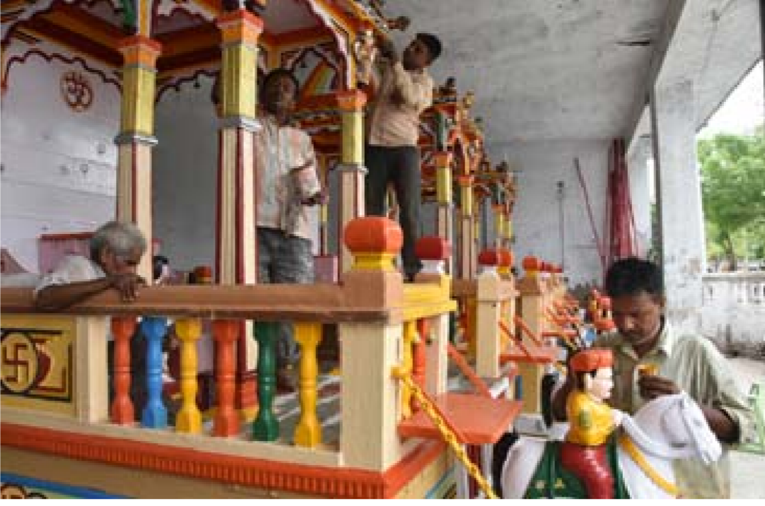
અપાદી બીજે અમદાવાદ શહેરના જગન્નાથ મંદિરેથી નિકળનારી રથયાત્રા પૂર્વેની તૈયારીઓ મંદિર પરિસરમાં શરૂ થઈ ગઈ છે. શહેરના જમાલપુર વિસ્તારમાં આવેલા મંદિર ના પ્રાંગણની સામે ની ઈમારતમાં મુકાયેલા ભગવાન જગન્નાથ, સુભદ્રાજી અને બલરામજીના રથને દર વર્ષે સમારકામ, સાફ સફાઈ સાથે રંગો થી સજાવવામાં આવે છે. શનિવારની વહેલી સવારે કુશળ કારીગરો દ્વારા રથોનું રંગ રોગાન કરાયું.